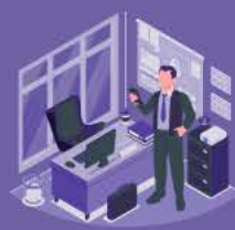
نوآوری و تحقیق و توسعه